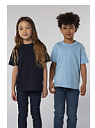
SOL'S Imperial KIDS 11770